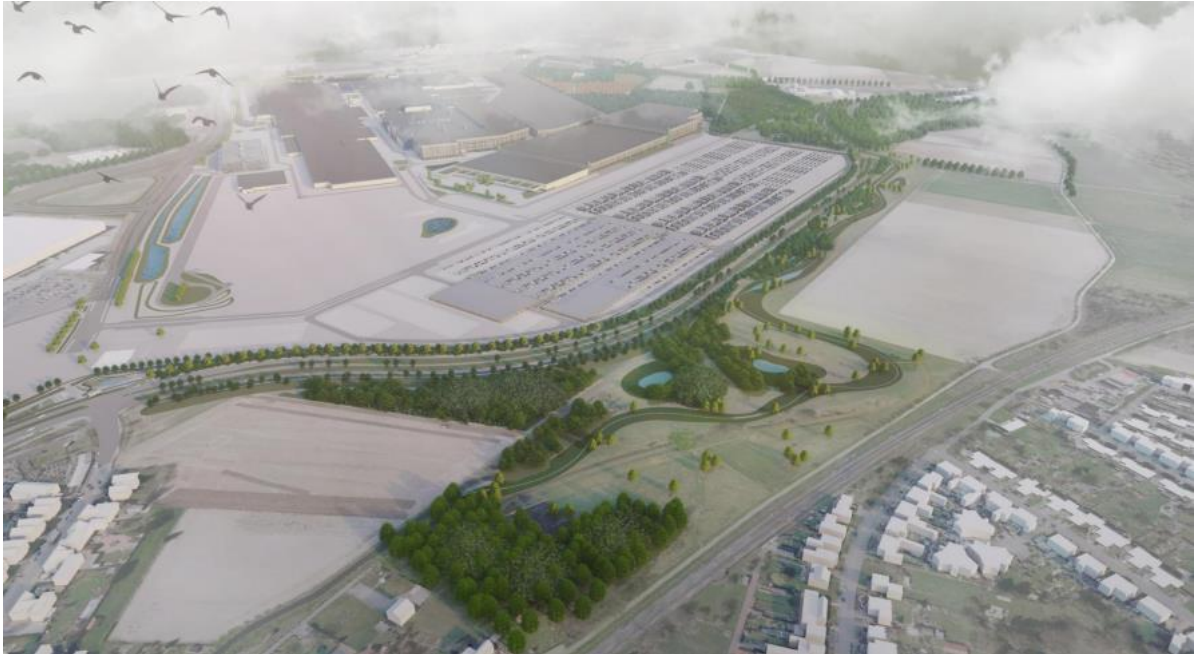
Figuur 4: Vogelvluchtperspectief Yard-E en nieuwe randweg