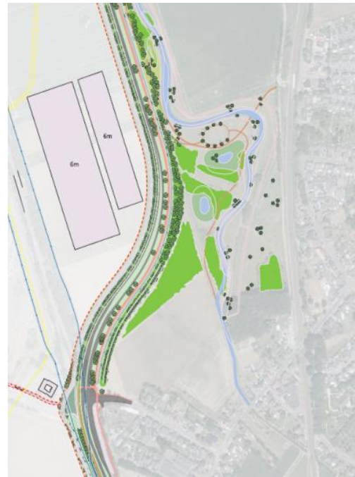
Figuur 3: Uitsnede beeldregieplan

Ter plekke is voor de landschappelijke inpassingen van de fabrieksuitbreiding en randweg voorzien in een grondwal van 3 meter hoog die beplant zal worden met opgaande struiken. Ook realiseert de Provincie Limburg een bosje in deze hoek dat na inrichting overgedragen wordt aan de gemeente Echt-Susteren. Ook dit bosje schermt het fabrieksterrein en de randweg visueel af en draagt eraan bij de kwaliteiten van het bestaande uitloopgebied zo goed als mogelijk te behouden. Het betreffende bosje kan ook dienen als schuilplek voor groot- en kleinwild. Zie hiervoor ook figuur 3.