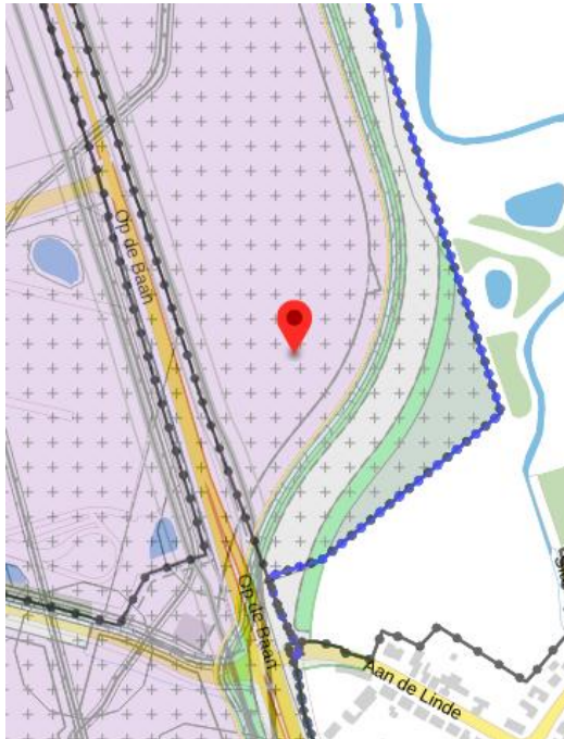
Figuur 2: Uitsnede PIP met groen aangeduid de Natuur- en Groenbestemming voor landschappelijke inpassing